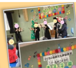
洗足学園 クリスマスコンサート @二子こ文