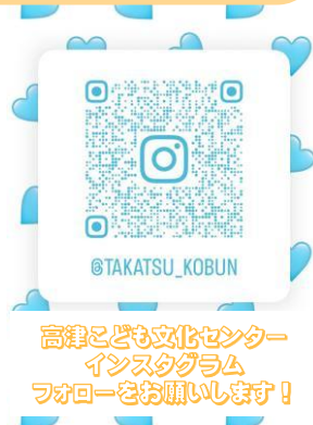
高津こども文化センター Instagram フォローをお願いします！