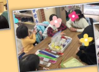
クリスマスリース作り