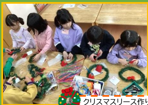
クリスマスリース作り