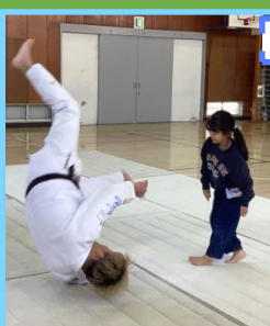
はじめての柔道教室