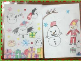
クリスマスカード作り