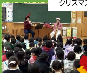
クリスマスお楽しみ会