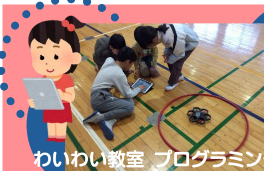
わいわい教室 プログラミング