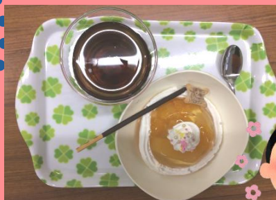
クリスマスデザート