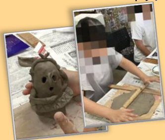
工芸こねこねクラブ