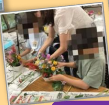
フラワー アレンジメント