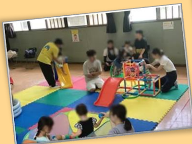
ベビープレイランド(大型遊具であそぼう！)