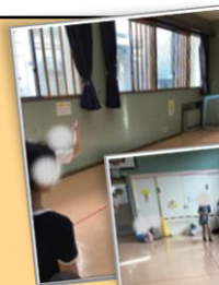
みんなでスポーツ ボウリング