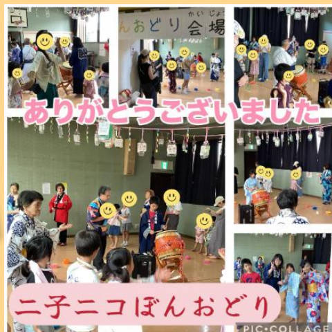
ニ子ニコぼんおどり