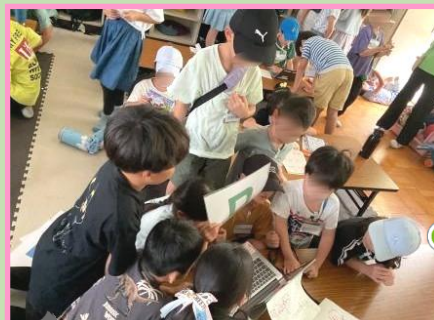
キッズ仮面 からの挑戦状!

他の学童施設をオンラインでつなぎ、 みんなで力を合わせてクイズに挑戦 しました!