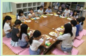
キッズカフェで パフェ作り