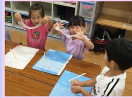
キラキラスライム