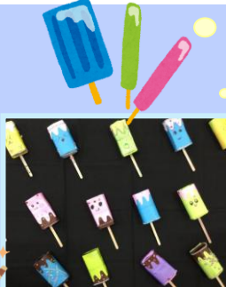
★アイスクャンディー工作