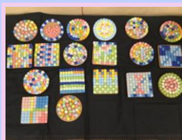
キラキラコースター