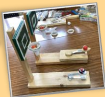
3Dプリンターを 利用した工作