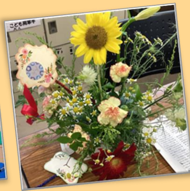
フラワーアレンジメント