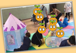
大型遊具で あそぼう