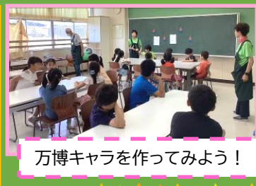
万博キャラを作ってみよう！