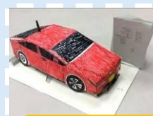
ペーパークラフト ～すごいカスタム作品～