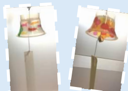
風鈴を作ってみよう