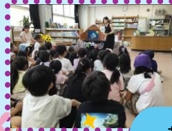
おりがみ教室 海の生き物たち