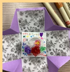
ギフトカード&ミニブーケ