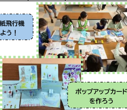
ポップアップカード を作ろう