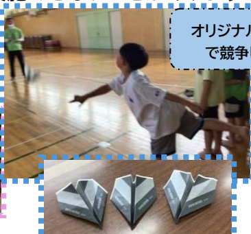
オリジナル紙飛行機 で競争しよう！