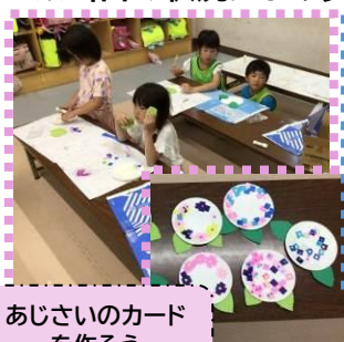
あじさいのカード を作ろう