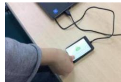
保護者様へ入室メール

千葉市が整備したWi-Fi設備を利用して、学校から出されるギガタブの宿題や課題をすることが可能となりました。