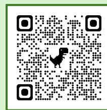
ちば電子申請サービス