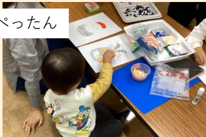
ちょきちょきぺったん