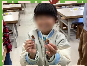
どんぐりトロも大人気でした