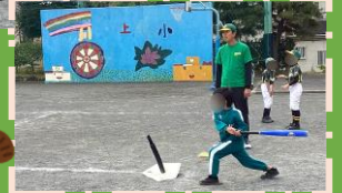
三角ベースボール大会