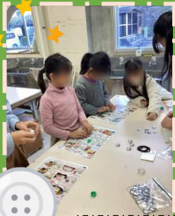
くるみボタン 自分で好きな柄を選びました