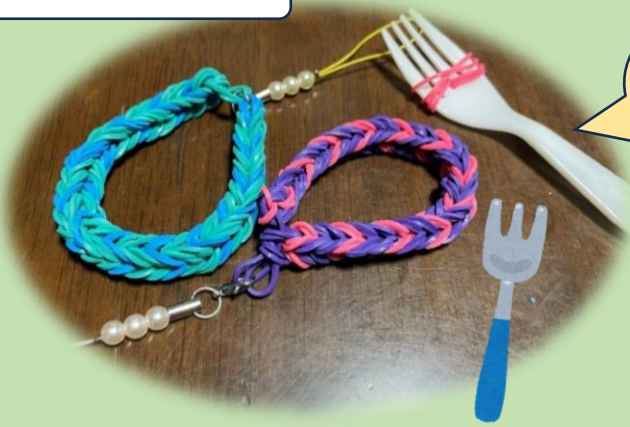
カラフルラバーバンド