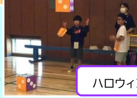
ハロウィンパーティー