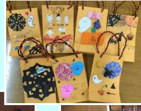
ハロウィンバッグ