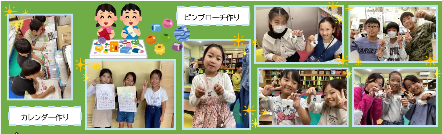
ピンブローチ作り