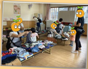
おさがりバザール