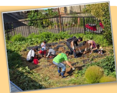
さつまいも収穫祭