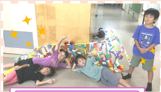
ジェットコースターだい！