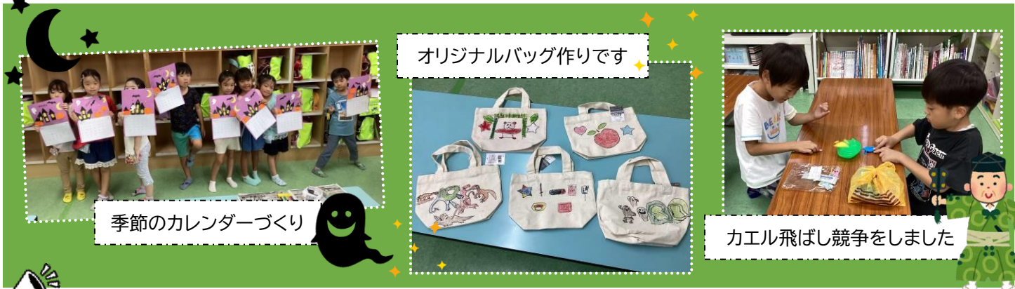
オリジナルバッグ作りです