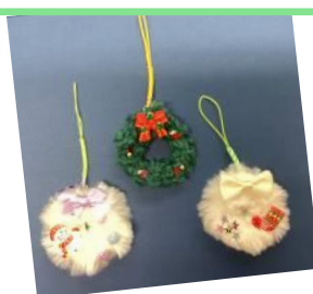
クリスマスリングづくり