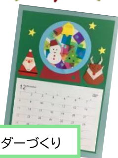
季節のカレンダーづくり