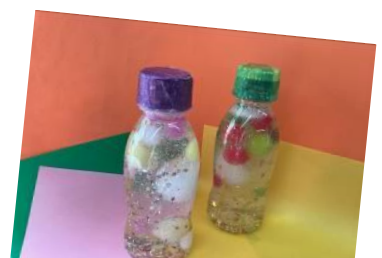
キラキラドームづくり