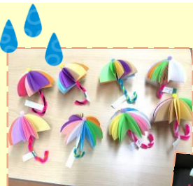
紙工作 (アンブレラ)