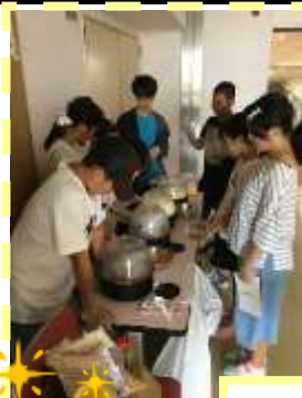
ポップコーン作り