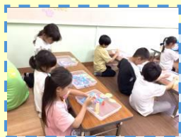
あじさいランタン