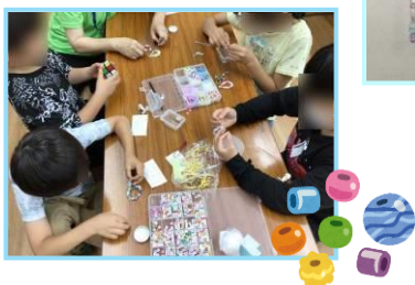
UV ビーストラップ作り