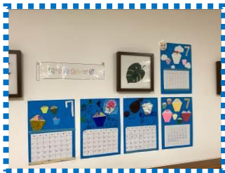
My カレンダーづくり