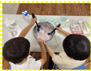
クッキングプログラム