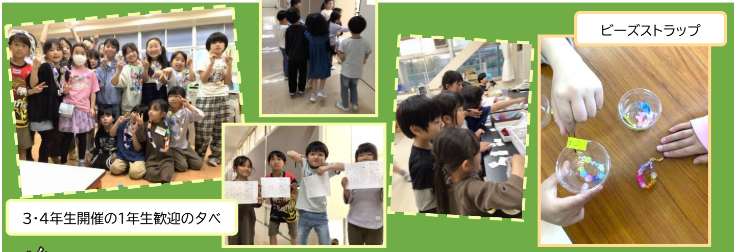
ビーズストラップ