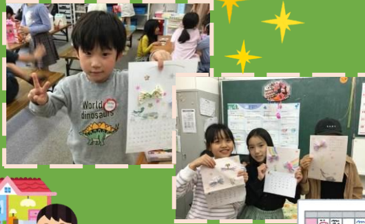
カレンダーづくり