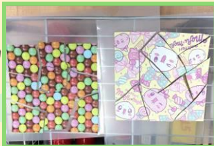
簡単パズルづくり