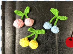
毛糸で編んでみたよ！