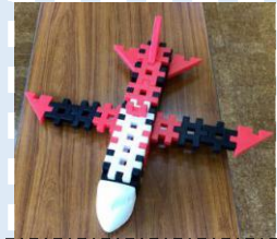
ブロックで作ってみたよ！