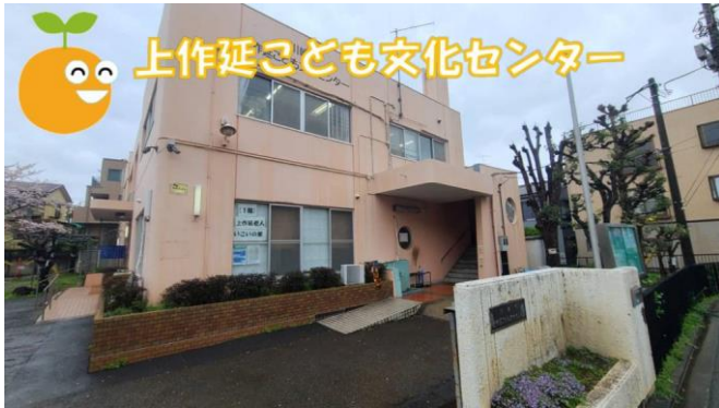
上作延こども文化センター

かいかんび ねんまつねんし のぞ まいにち 開館日 年末年始(12/29~1/3)を除く毎日 かいかんじかん へいじつ とうよう 開館時間 平日/土曜 9:30~21:00 にちよう しゅくじつ 日曜/祝日 9:30~18:00