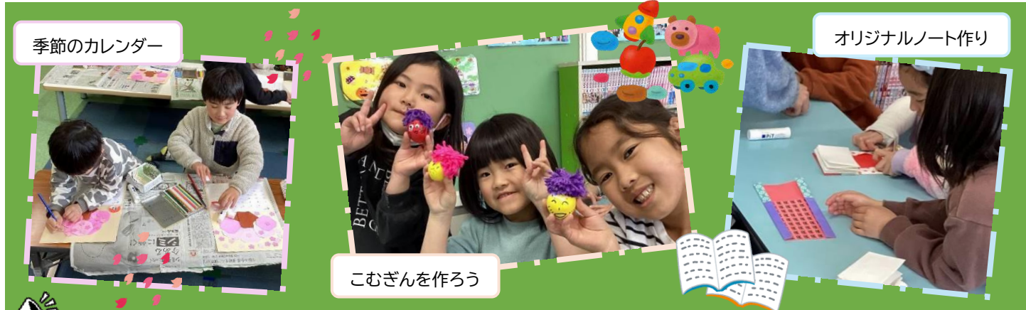
季節のカレンダー