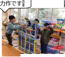
レゴブロック&プラレール