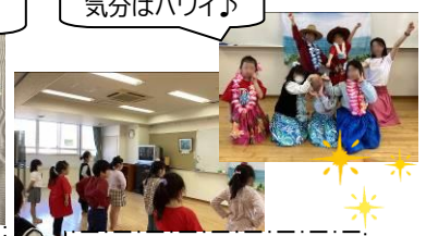
フラダンス教室 第3回