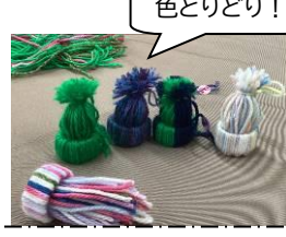
毛糸の帽子のマスコット