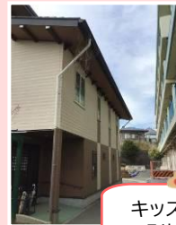
キッズクラブ 別棟です！