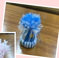
ミニチュアニット帽子