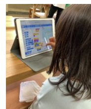
プログラミング教室