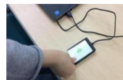
保護者様へ入室メール