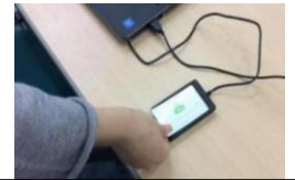
保護者様へ入室メール