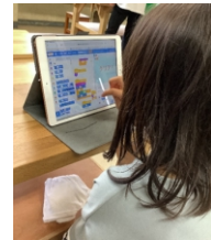
プログラミング教室