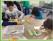
大きな干支作品を作ろう