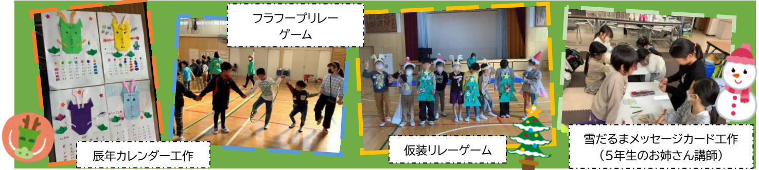
辰年カレンダー工作