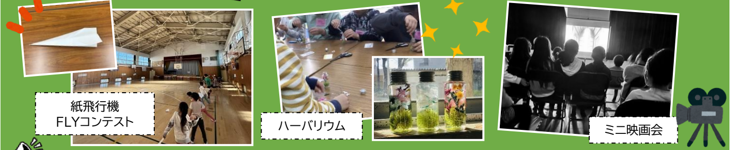
紙飛行機 FLYコンテスト