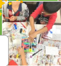
スタンドグラス 工作