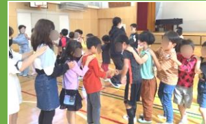
ハロウィンゲーム大会