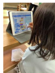
プログラミング教室