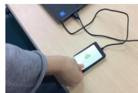
保護者様へ入室メール