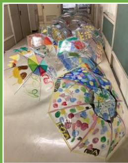
オリジナル傘作り