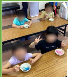
かき氷 食べました！