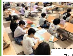
みんなで宿題タイム

【コパールを磨いて、古代の生物を見つけよう】 生物の進化と変態の違いについて授業を受けました。コパールを磨いて、生物が入っていないか夢中になって探しました！