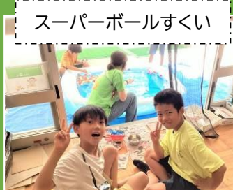
スーパーボールすくい