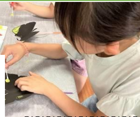
はばたくちょうちょ