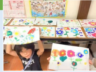
7月の花 スタンプと染色