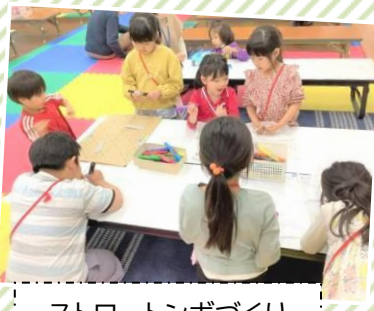
ストロートンボづくり