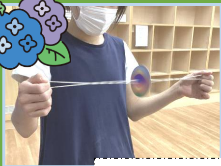
ブンブンこま作り